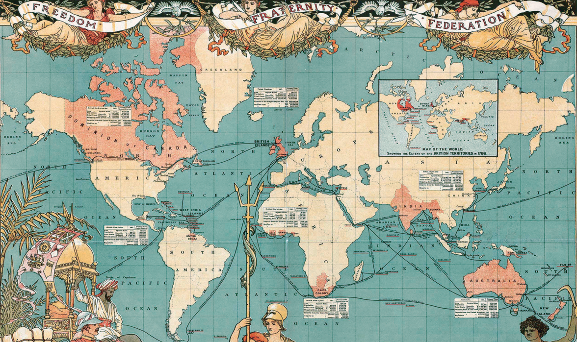
IMPERIUL BRITANIC LA 1886